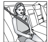
Cinturón de seguridad de cadera y hombro