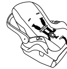
Asiento de seguridad con base